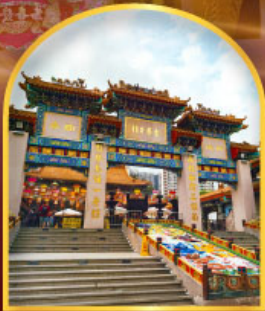
วัดหวังต้าเซียน ขอพรด้านสุขภาพ