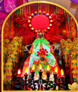
เจ้าแม่กวนอิมฮ่องฮ่า ที่มีอายุกว่า 600 ปี