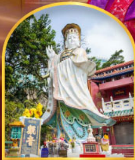
เจ้าแม่กวนอิม ธิลิสเบย์ ขอพรเกี่ยวกับธุรกิจ และ การเงิน