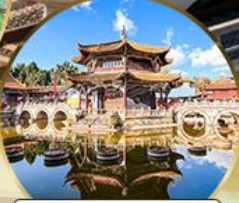
วัดหยวนทอง