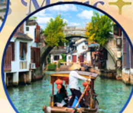
เมืองโบราณจูเจียเจีย