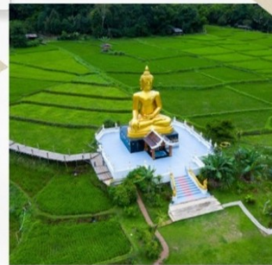
บ้านนาคูนา