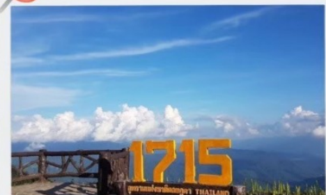
จุดชมวิวที่มีความสูง 1715