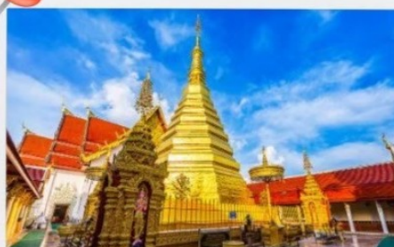
วัดพระธาตุดอยฮ่อ