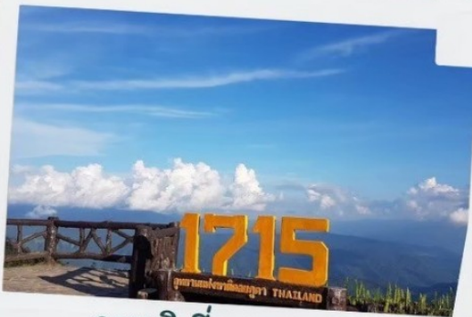
จุดชมวิวที่ความสูง 1715