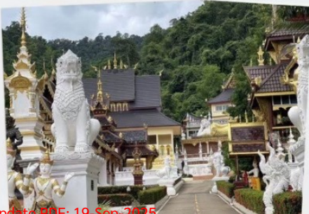
วัดจำเริญ