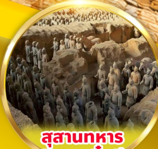
สุสานทหาร ดินเผาจีนซี