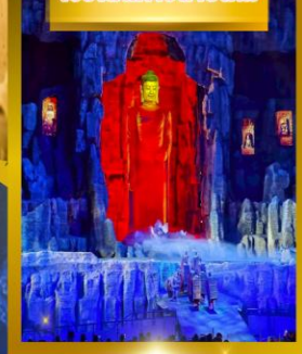
โชว์เส้นทางสายไหม