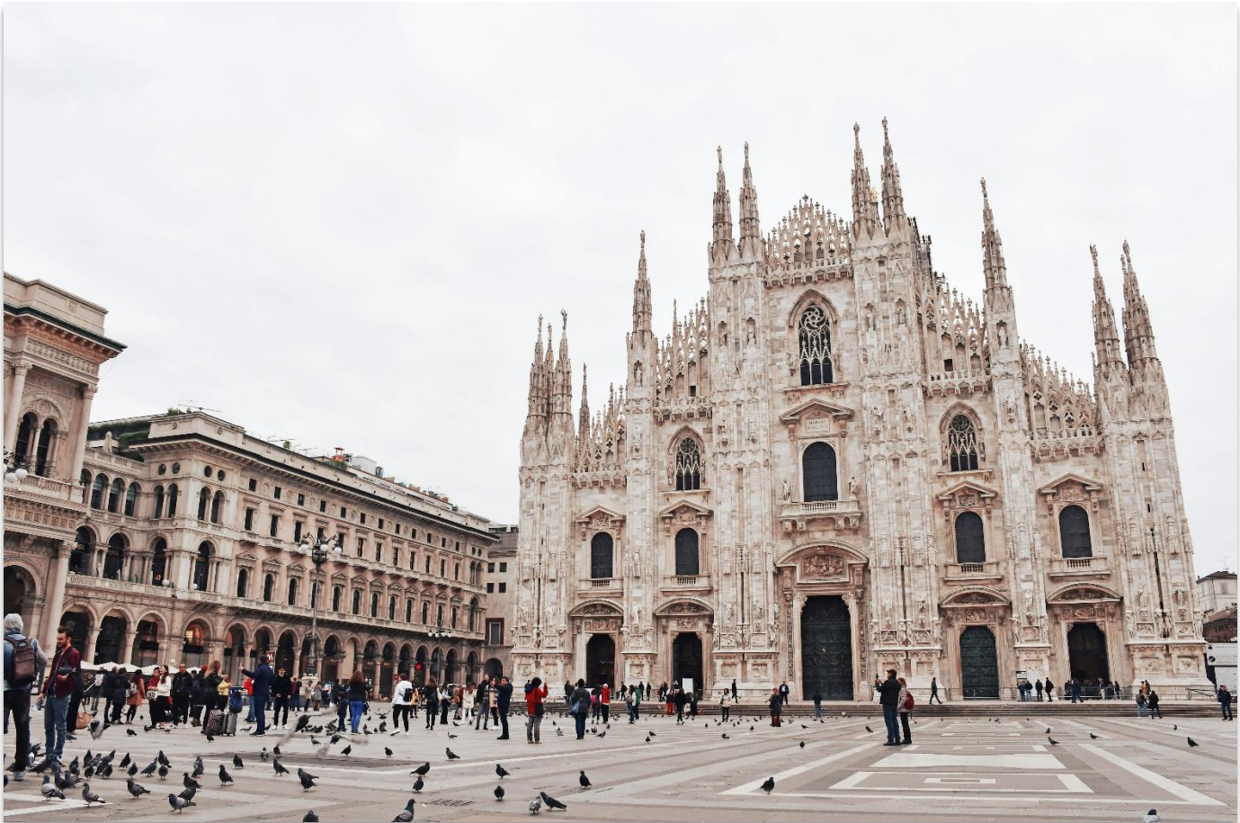
DUOMO DI MILANO

เมืองมิลาน (Milan) มิลานเป็นเมืองสำคัญทางตอนเหนือของประเทศอิตาลี ตั้งอยู่บนที่ราบลอมบาร์ดี โดยชื่อ "มิลาน" มีรากศัพท์มาจากภาษาของชาวเซลต์ คือ "Mid-Lan" ซึ่งมีความหมายว่า “กลางที่ราบ” เมืองมิลานมี ชื่อเสียงระดับโลกในด้านแฟชั่น ศิลปะ และวัฒนธรรม และยังเป็นหนึ่งในเมืองหลักทางเศรษฐกิจของอิตาลีอีก ด้วย นำท่านถ่ายภาพเป็นที่ระลึกบริเวณด้านหน้าของ “มหาวิหารมิลาน” (Duomo di Milano) หนึ่งในมหา วิหารสไตล์กอธิคที่ใหญ่ที่สุดในโลก (ค่าทัวร์ไม่รวมค่าเข้าชมในของมหาวิหารแห่งเมืองมิลาน)นอกจากนั้นให้