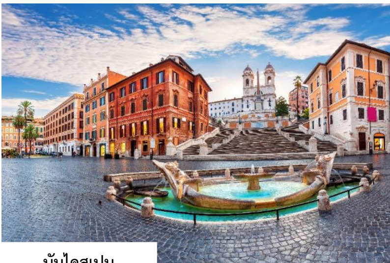
บันไดสเปน (SPANISH STEPS)