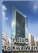
i Club To Kwa Wan