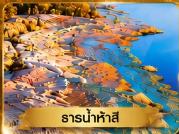
ธารน้ำห้ำสี