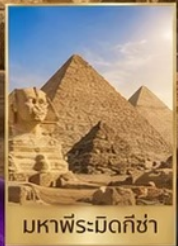
มหาพีระมิดกิซ่า