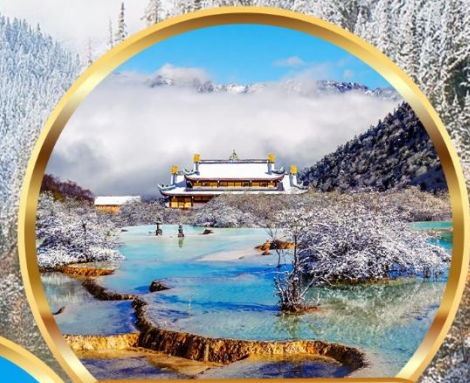
อุทยานหวงหลง