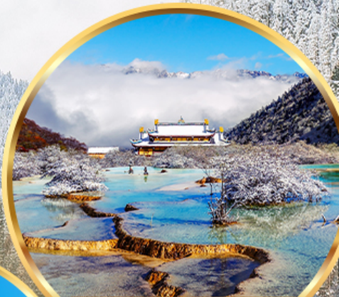
อุทยานหวงหลง