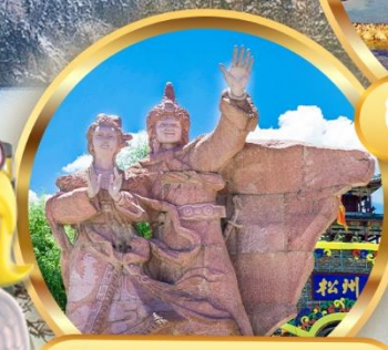
เมืองโบราณซงพาน