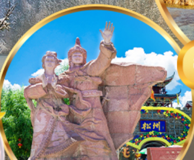
เมืองโบราณขงฟาน