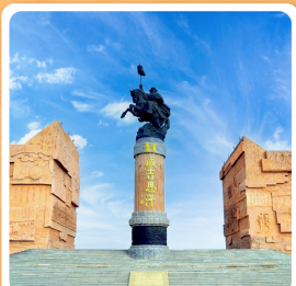
เขตท่องเที่ยวเจงกีสข่าน