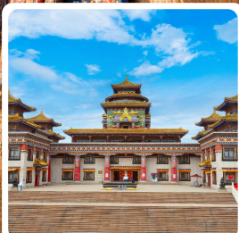
ทำเนียบพระลามะอูหลาน