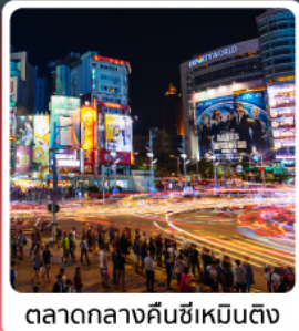
ตลาดกลางคืนซีเหมินติง