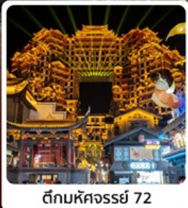
ตีกรมหัตถกรรม 72