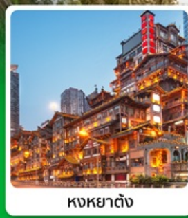
หงหยาด้ง