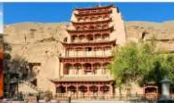
ต้าเถะสลิกม่อเถาสุ