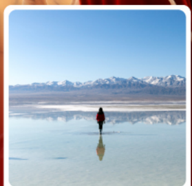
ทะเลสาบซิงไห่