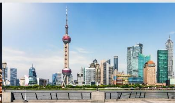
หาดไว่ถาน