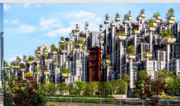
Tian An 1,000 Trees