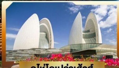
ดูให้โอเปร่าเฮ้าส์