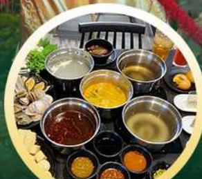
ซาบู่ฮ่องกง

02-04 มี.ย. 18-20 มี.ย. 07-09 มี.ย. 20-22 มี.ย. 13-15 มี.ย. 25-27 มี.ย. 14-16 มี.ย. 28-30 มี.ย.