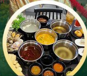
ซาบูฮ่องกง

02-04 มิ.ย. 18-20 มิ.ย. 07-09 มิ.ย. 20-22 มิ.ย. 13-15 มิ.ย. 25-27 มิ.ย. 14-16 มิ.ย. 28-30 มิ.ย.