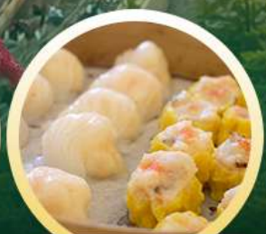
ตี๋มซ่าฮ่องกง