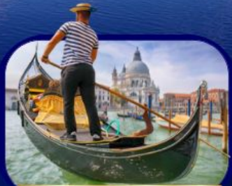
เที่ยวเกาะเวนิส