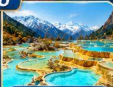
หวงหลง อุทยานหินปูนสีทอง