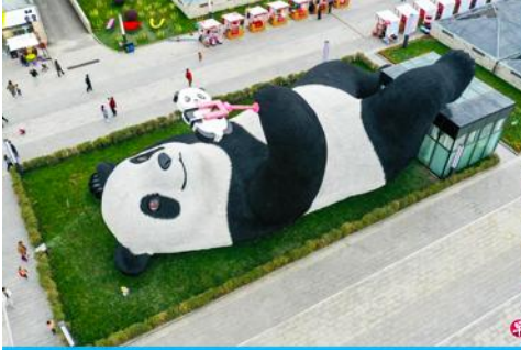
ตุ๊กตาหมีแพนดาเซลฟี