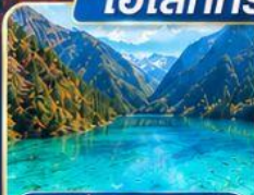
จิ่วจ้ายโกว ดินแดนแห่งสายน้ำ 5 สี