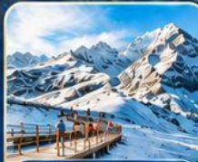
ต้ากู่ปิงชว่น ธารน้ำแข็งใสที่สุดฟ้า