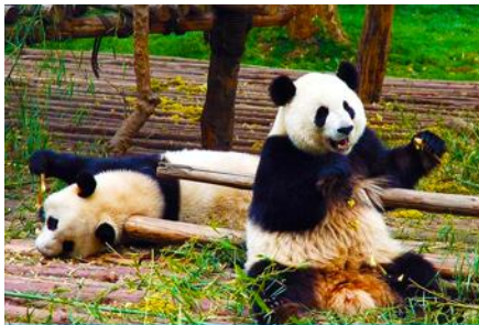
ศูนย์อนุรักษ์หมีแพนดาเมืองตู่เจียง