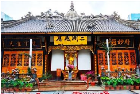
ถนนไท่กุหลี่ และวัดต้าจิว