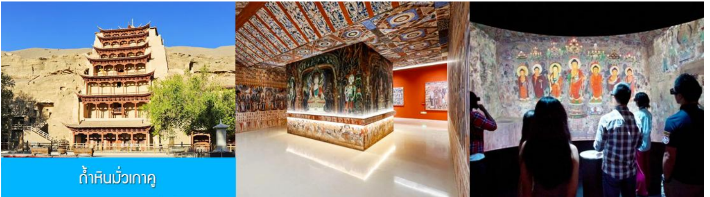
ถ้ำหินมั่วเกา

เช้า รับประทานอาหารเช้า ณ ห้องอาหารของโรงแรม (1)