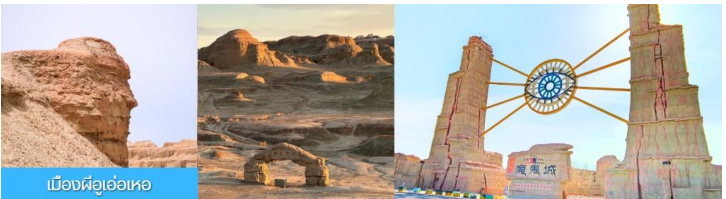
เมืองฝืออ๋อเหอ

รับประทานอาหารเช้า ณ ห้องอาหารของโรงแรม (13)