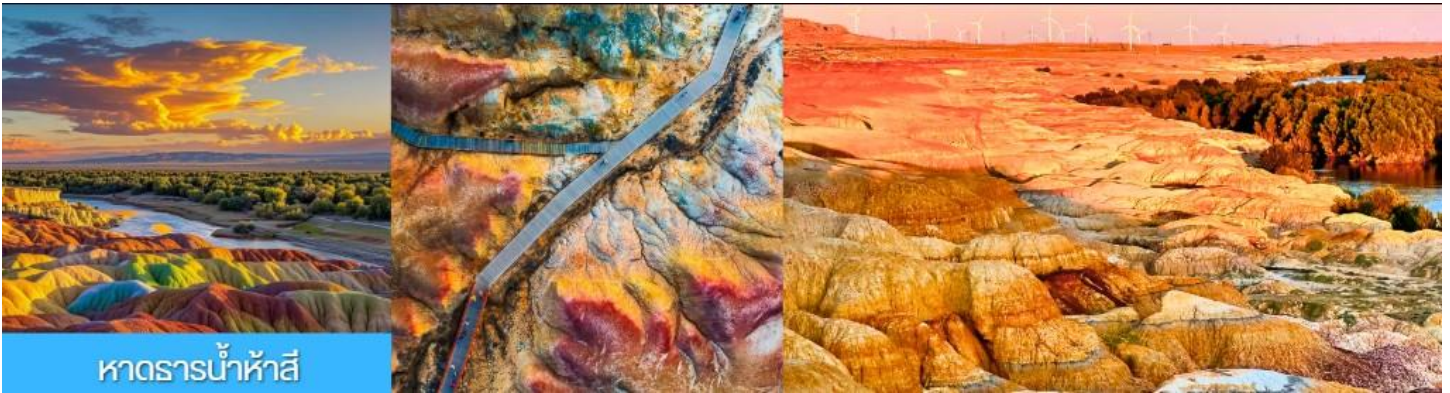
หาดทรายน้ำห้าสี