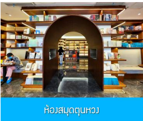
ห้องสมุด둔หวง