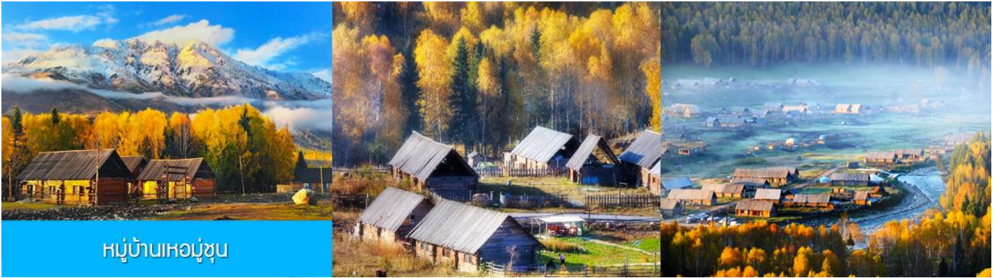
หมู่บ้านเหอหมู่บ้าน