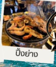
บั้งย่าง