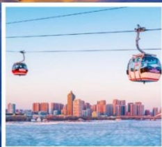
นั่งกระเช้าชมแม่น้ำของฮวาเจียง