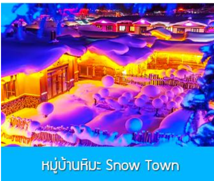
หมู่บ้านหิมะ Snow Town

ท่ามกลางท้องทุ่งและผืนป่าที่ปกคลุมด้วยหิมะราวกับอยู่ในโลกแห่งเทพนิยาย ผ่านหมู่บ้าน เวยหูจ้าย 威虎寨 ที่อดีตเคยเป็นที่ตั้งของรังโจรที่มักออกปล้นสะดมชาวบ้าน ม้าลากเลื่อนเป็นยานพาหนะเฉพาะพื้นที่ ๆ ที่นิยมนำมาใช้ในการเดินทางหรือลำเลียงสิ่งของในช่วงฤดูหนาว ที่ใช้ม้ามาลากงูแครงเลื่อนให้สามารถเคลื่อนย้ายบนลานหิมะได้