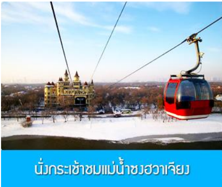
นั่งกระเช้าชมแม่น้ำซวงฮวาเจียง

พักที่ VIENNA INTER HOTEL โรงแรมระดับ 4 ดาวท้องถิ่น ในเมืองเมืองซ่งจื่อ