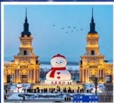
ตึกตาคิมะฮักซ์