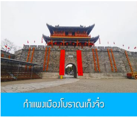
กำแพงเมืองโบราณเก็งจิว