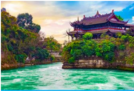
เขื่อนตูเจียงเยี่ยน