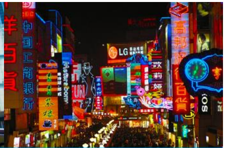
ถนนคนเดินชุนซี้