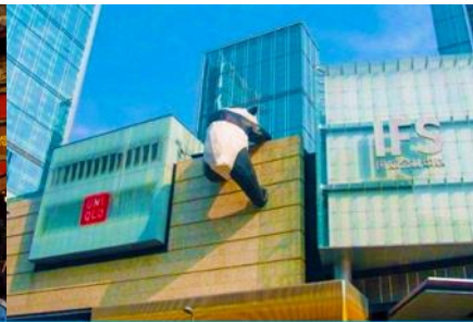
หมีแพนด้าปีนตึก ณ ตึก IFS