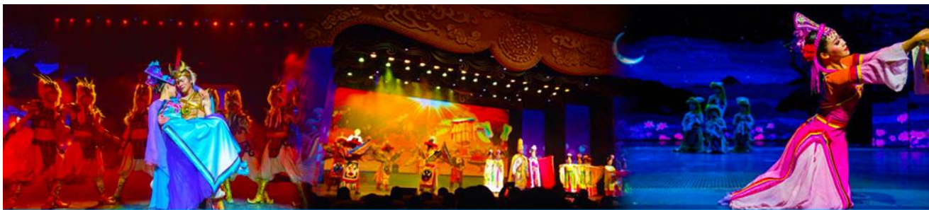
Romantic Show of Jiuzhai

หมายเหตุ : การท่องเที่ยวภายในอุทยานนั้นไกด์และหัวหน้าทัวร์ จะใช้วิจารณญาณในการนำท่านเดินทางท่องเที่ยวตามจุดชมวิวดังต่าง ๆ ภายในอุทยาน ซึ่งจะพยายามไปเที่ยวให้ได้มากที่สุด เท่าที่สามารถทำได้ ทั้งนี้ขึ้นอยู่กับการใช้เวลาในแต่ละสถานที่ และความร่วมมือในการรักษาเวลาของคณะทัวร์ และสภาพอากาศในวันนั้นๆ ณ วันเดินทาง หากคณะไม่สามารถเดินทางไปชมอุทยานจิวจ้ายโกวได้ ไม่ว่าจะเนื่องจากสภาพอากาศ หรือเหตุผลใดๆ ทางบริษัทฯ ขอสงวนสิทธิ์ในการเปลี่ยนสถานที่ท่องเที่ยวเป็น “อุทยานแห่งชาติชงผิงโกว” และ/หรือสถานที่ที่เกี่ยวเนื่องแทน