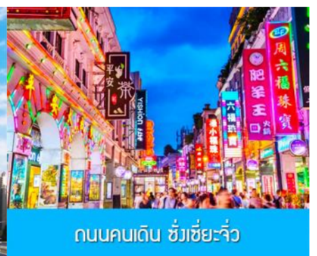
ถนนคนเดิน ซังเซี่ยจิว