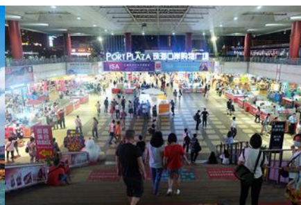
ตลาดใต้ดินกวางเป่ย์