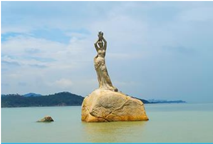
จูไห่พีชเซอร์กิส

พักที่ IRVINE HOLIDAY HTL OR HUICHANG HTL 3* หรือ โรงแรมในระดับเดียวกันในเมืองจูไห่