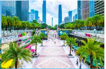
จตุรัสฮัวเจิง