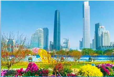
ไห่ซินซา