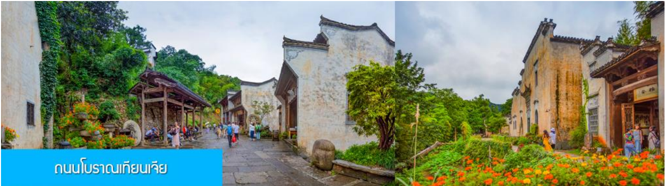
ถนนโบราณเทียนเจีย