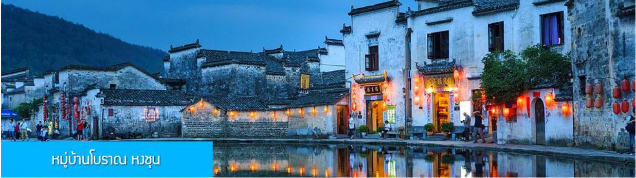
หมู่บ้านโบราณ หงซุน

พักที่ โรงแรม JIANGNAN HAOTING HOTEL ระดับ 4 ดาวห้องดีนหรือเทียบเท่าในเมืองช่งเหรา