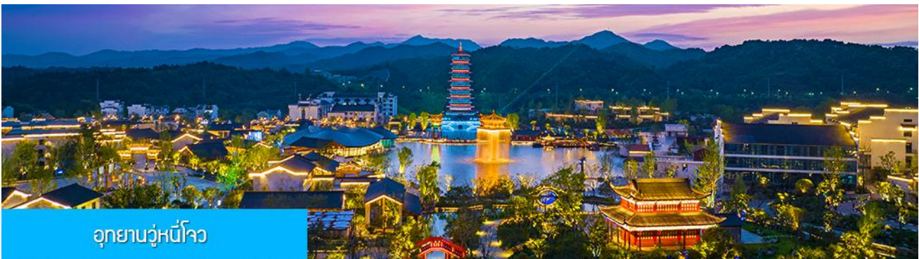
อุทยานวู่หนี่โจว

หลังอาหารนำท่านนั่งกระเช้าลงจากหมู่บ้านหวงหลิ่ง นำท่านขึ้นรถบัสเดินทางสู่อุทยานวู่หนี่โจว