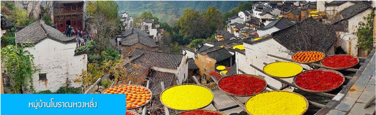
หมู่บ้านโบราณหวงหลิ่ง