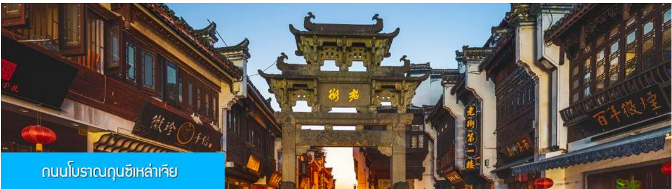
ถนนโบราณถุนซีเหล่าเจีย

หลังอาหารนำท่านเที่ยวชม หมู่บ้านโบราณหงซุน 宏村 หมู่บ้านโบราณจีนซึ่งอายุกว่า 800 ปีที่ได้รับการขึ้นทะเบียนเป็นมรดกโลกทางวัฒนธรรมจาก UNESCO ชมบ้านเรือนโบราณที่ถูกสร้างขึ้นในยุคราชวงศ์หมิง และราชวงศ์ชิงที่ยังคงสภาพที่สมบูรณ์กว่า 140 หลัง นำท่านเที่ยวชมตามจุดเช็คอินขึ้นชื่อภายในหมู่บ้าน อาทิ บึงน้ำพระจันทร์ ทะเลสาบหนานหู โรงเรียนหนานหู หอบรรพบุรุษ คลองน้ำหงซุน ต้นไม้โบราณ ฯลฯ จากนั้นนำท่านเดินทางสู่เมือง หวงซาน (ระยะทาง 70 กม. ใช้เวลาเดินทางราว 1 ชั่วโมง)