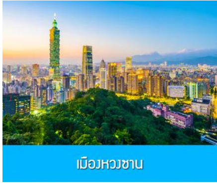
เมืองหวงซาน