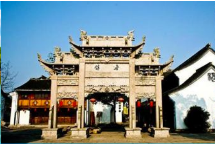
เมืองโบราณ หลู่จื๋อ