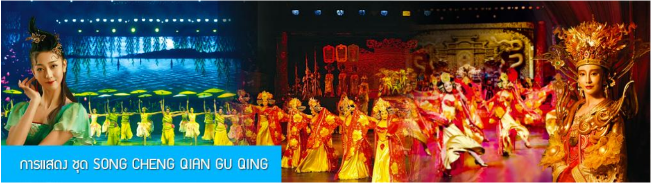
การแสดง ชุด SONG CHENG QIAN GU QING