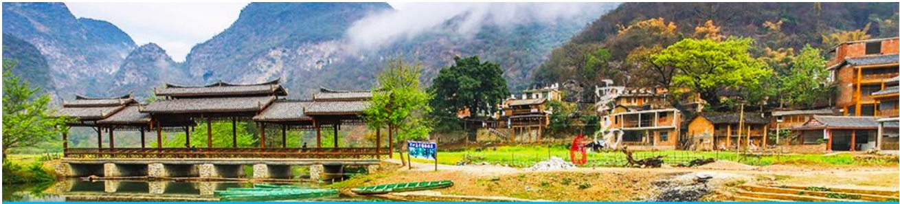
สวนดอกท้อ