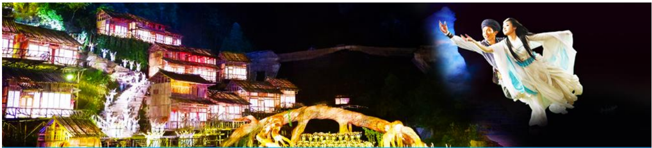
The Love Story of a Wooden Man and Fairy fox

ให้ท่านเก็บภาพบรรยากาศจนได้เวลาอันสมควร นำท่านนั่งกระเช้าลงจากเขาเทียนเหมินซาน ด้านกระเช้าใหญ่ฝั่งโรงละคร โชว์จิ้งจอกขาว