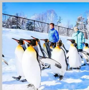
“PENGUIN ASAHİYAMA ZOO”