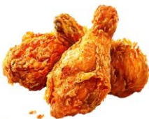
● เนื้อสัตว์ปีก (ไก่)