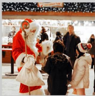
“ODORI GERMAN MARKET”