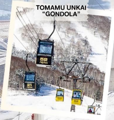
TOMAMU UNKAI “GONDOLA”