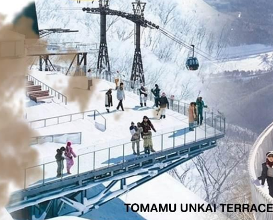
TOMAMU UNKAI TERRACE