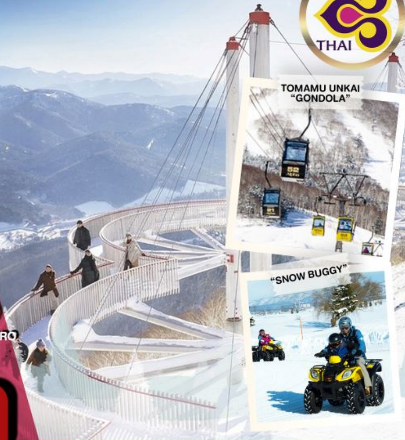
TOMAMU UNKAI "GONDOLA"