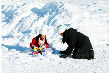
Playing in the snow