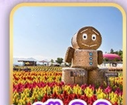
สวนซึกึชิโนะโอะกะ