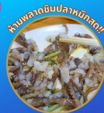
ซีมันิกจิ อาหารท้องถิ่น

ชมดอกคามิเลียที่เกาะดองแบกโซม "โพฮังสเปซวอล์ก" สกายวอร์ค นั่งเคเบิลคาร์ ชมทะเลปูซาน ห้ามพลาด!! ตลาดปลาที่ใหญ่ที่สุด ถ่ายรูปชิคๆ หมู่บ้านวัฒนธรรมคิมซอน เชคอินแหล่งสุดปัง The Bay101 ช้อปปิ้งตลาดพื้นเมือง อิสระช้อปปิ้ง Lotte Duty Free