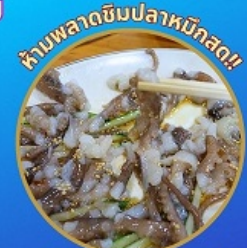
หามพลาดชิมปลาหมึกสด!!

ชมดอกคามิเลียที่เกาะดองแบกโซม "โพฮังสเปซวอล์ค" สกายวอร์ค นังเดบีลคาร์ ชมทะเลปูซาน หามพลาด!! ตลาดปลาที่ใหญ่ที่สุด ถ่ายรูปชิคๆ หมู่บ้านวัฒนธรรมคัมซอน เชคอินแหล่งสุดปัง The Bay101 ช้อปปิ้งตลาดพื้นเมือง อิสระช้อปปิ้ง Lotte Duty Free