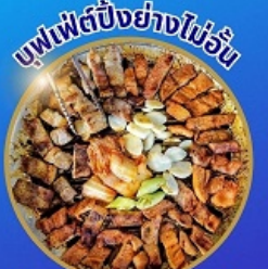
บุฟเฟ่ต์ปิ้งย่างไม่อั้น