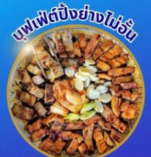
อาหารพรีเมียม ไม่ลงร้านอาหาร