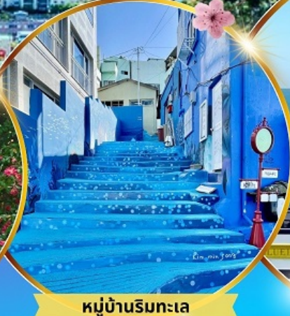
หมู่บ้านริมหทะเล