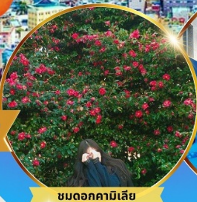
ชมดอกคามิเลีย