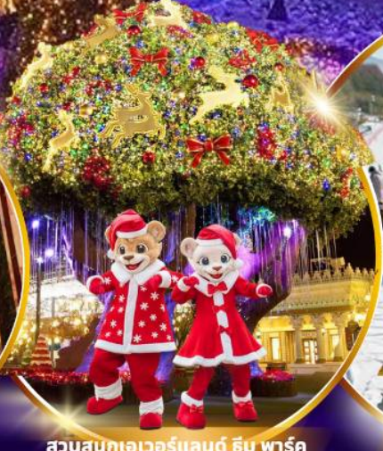
สวนสนุกเอเวอร์แลนด์ ซิม พาร์ค