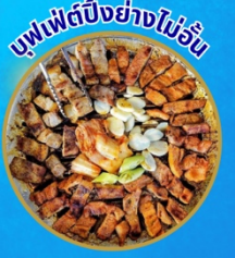
บุฟเฟ่ต์ปิ้งย่างไม่วัน