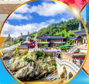
วัดแฮดยงกุงซา