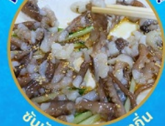
ชั้นนักชี อาหารท้องถิ่น