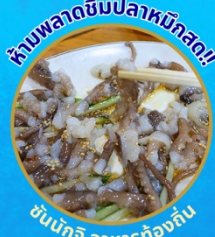
หินพลัดชิมปลาหมึกสด!! ซันนั๊กจิ อาหารท้องถิ่น

โปฮังสเปซวอล์ก สกายวอร์ค ตามรอยซีรีส์ Hometown chachacha ถ่ายรูปชิคๆ หมู่บ้านวัฒนธรรมคัมซอน ขึ้นเคเบิลคาร์ ชมทะเลปูซาน นั่งรถไฟปู๊กปิก sky capsule ชิมของอร่อยตลาดแฮอนแด อิสระช้อปปิ้ง Lotte Duty Free