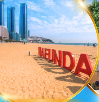
หาดแฮอนแด