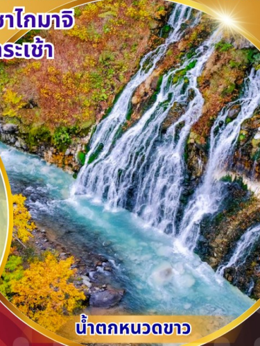
น้ำตกหมวดขาว