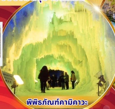
พิพิธภัณฑ์คามิดาวะ