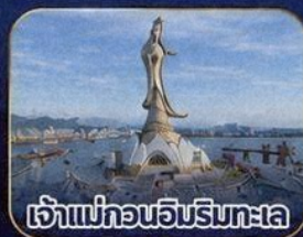
เจ้าแม่ท่อนักริมทะเล