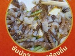
ชั้นนักชี อาหารท้องถิ่น