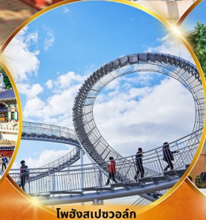
โพฮังสเปซวอล์ค