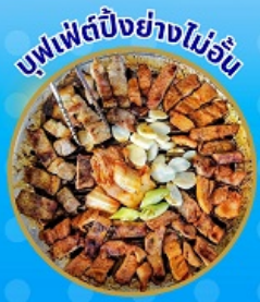
บุฟเฟ่ต์ปิ้งย่างไม่อื่น