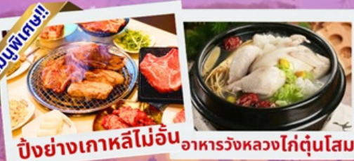
ปิ้งย่างเกาหลีไม่อื่น อาหารวังหลวงไก่ตุ๋นโสม