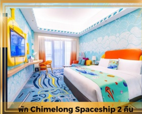
พัก Chimelong Spaceship 2 คืน