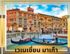
เวเนเซียน มาเก๊า