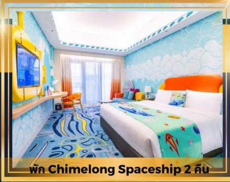
พัก Chimelong Spaceship 2 คืน