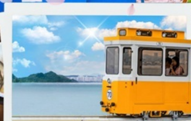
รถไฟลอยฟ้า Sky Capsule