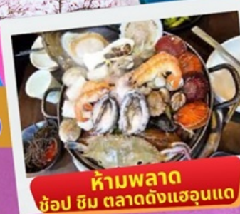
ห้ามพลาด ช้อปปิ้ง ตลาดดงแฮอนแด