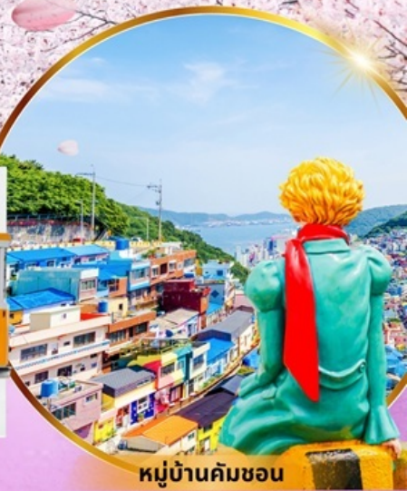
หมู่บ้านคิมซอน