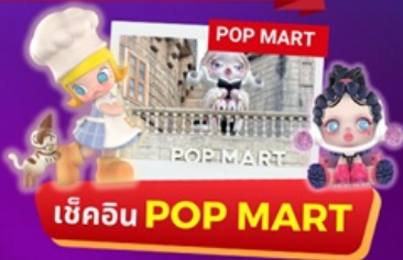
เข้คิน POP MART