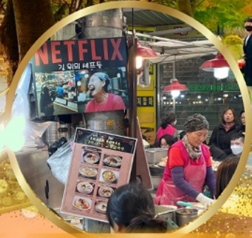
สตรีทฟู้ดตลาดกวางจง