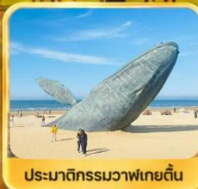
ประมาติกรรมวาฬไทยตัน