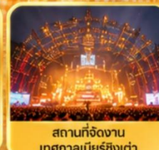
สถานที่จัดงาน เทศกาลเบียร์ชิงเต่า