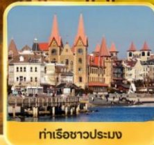
ท่าเรือชาวประมง