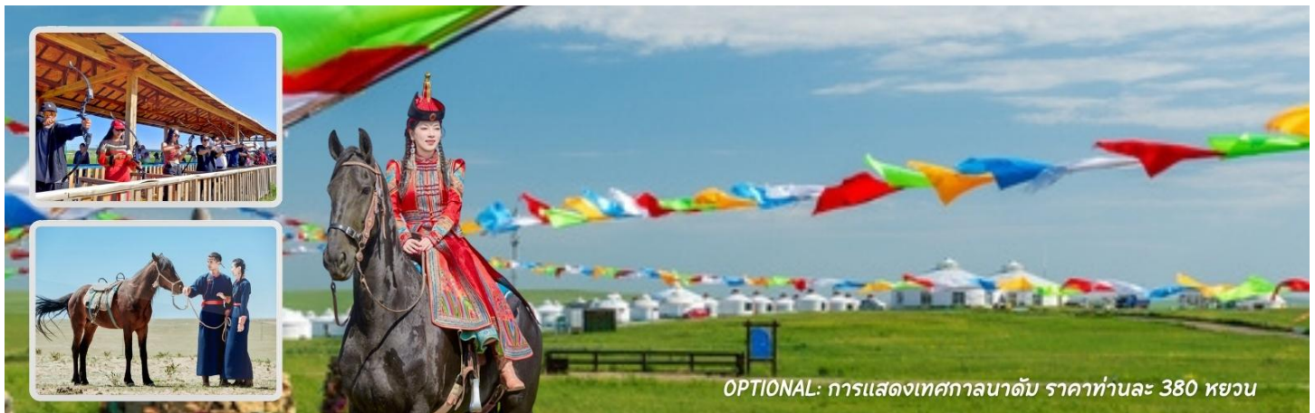
OPTIONAL: การแสดงเทศกาลนาดัม ราคาทำนละ 380 หยวน

หมายเหตุ : บางกิจกรรมอาจมีการเปลี่ยนแปลงโดยไม่ได้แจ้งให้ทราบล่วงหน้า ทั้งนี้ขึ้นอยู่กับสภาพภูมิอากาศในแต่ละปี รมกวนสอบถามกับทางไกด์ท้องถิ่น หรือหัวหน้าทัวร์ให้ละเอียดก่อนการตัดสินใจซื้อ