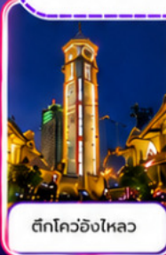
ตึกโควอิ่งไหลว