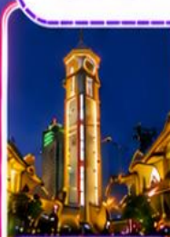
ตึกไครอิ่งไหลว