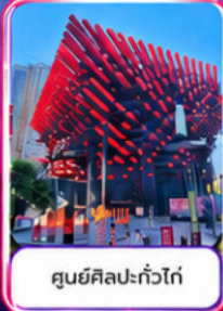
ศูนย์ศิลปะแก้วโก่