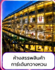
ห้างสรรพสินค้า การ์เด็นทววงหวน